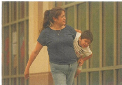
19日、山火事の影響を受けて設置されたカナダ西部・ブリティッシュコロンビア州ケロウナにある避難所で、幼い男の子を抱える女性